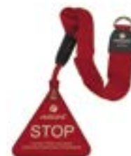
Redcord dveřní úchyt