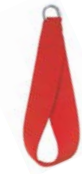
Redcord akrální popruh