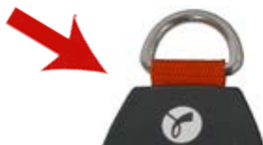
Popruh s červenou tkaninou