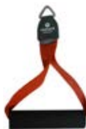
Redcord akrální popruh s úchytem