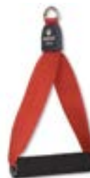
Redcord akrální popruh s úchytem