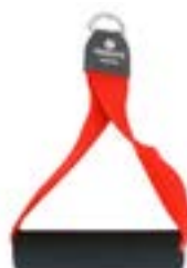
Redcord akrální popruh s úchytem