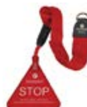
Redcord dveřní úchyt