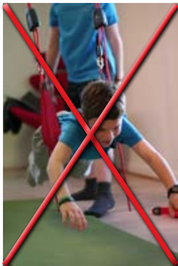
Popruh používaný jako houpačka