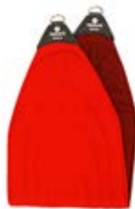
Redcord pánevní popruh