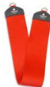
Redcord terapeutický popruh