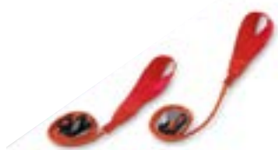
Redcord akrální popruh

NEpoužívejte tyto popruhy a akrální popruhy!