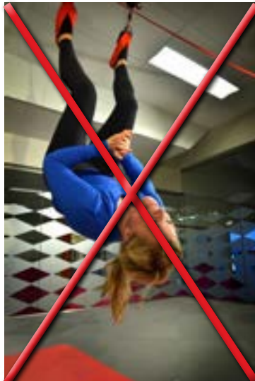
Ramena se nedotýkají podlahy