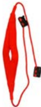
Redcord krční popruh