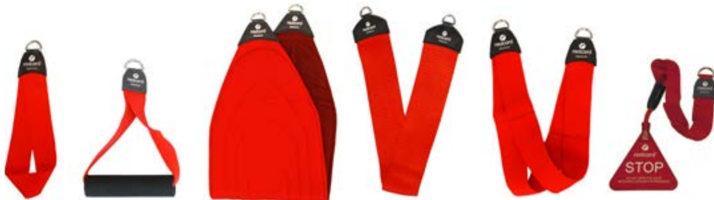
Redcord akrální popruh