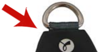
Popruh s šedou tkaninou

Šedá popruhová tkanina s extra UV ochranou: