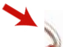
Redcord popruhy s plastovým D kroužkem

NEpoužívejte tyto popruhy a akrální popruhy!