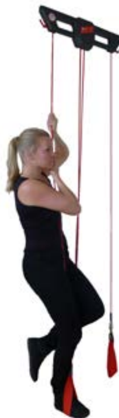
Testování akrálních popruhů a úchytů