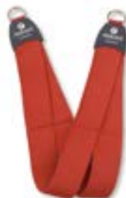
Redcord krční popruh