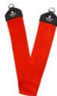
Redcord terapeutický popruh