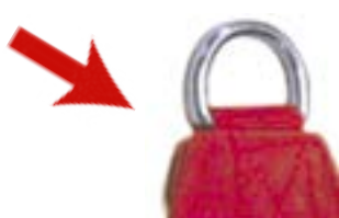
Redcord popruhy bez plastového pouzdra

NEpoužívejte tyto popruhy a akrální popruhy!