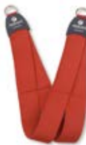
Redcord krční popruh