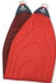
Redcord pánevní popruh