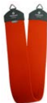
Redcord terapeutický popruh