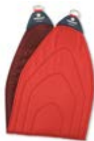
Redcord pánevní popruh

NEpoužívejte tyto popruhy bez UV ochrany.