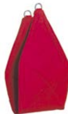
Redcord pánevní popruh