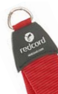
Redcord akrální popruh