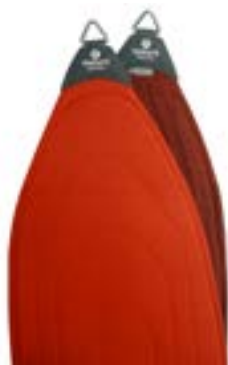
Redcord pánevní popruh