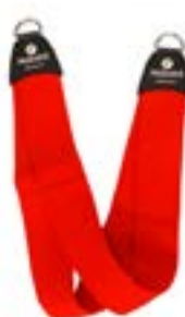
Redcord krční popruh