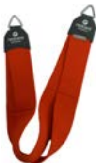
Redcord krční popruh