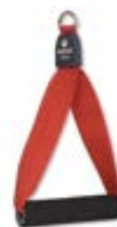
Redcord akrální popruh s úchytem